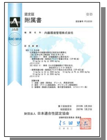
図 2. 認定証附属書(認定範囲)