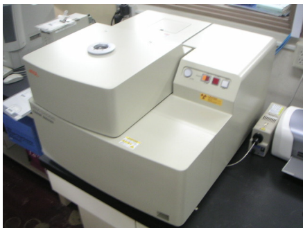
蛍光 X 線分析装置